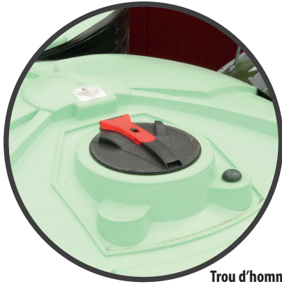
Trou d'homme (Ø 440mm) avec évent