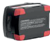
VOTRE BATTERIE 18V/20V